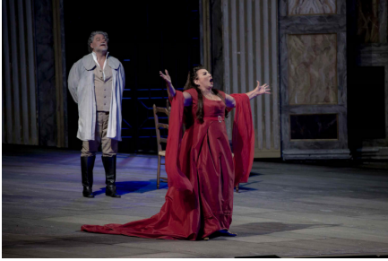
Jose Cura Maria Guleghina

Grizonat, cu look tomnatic și fizic impozant, tenorul argentinian José Cura (Mario Cavaradossi) și-a expus timbralitatea frumoasă, cu sunet dens, mai întâi afectat - la începutul spectacolului - de sonorități opace și de oarecare vibrato. Si bemol-ul înalt al primei arii, „Recondita armonia”, a fost prelung și bine susținut. În duetul subsecvent cu Tosca și-a revelat ușurința atacurilor acute, dar a cântat economic, cu atitudine scenică reținută, mișcare puțină, redusă la un fel de... strict necesar. Să spun, putea fi un îndrăgostit marcat, preocupat, de întâlnirea intempestivă cu Angelotti. În compania acestuia, spectaculoasă și energică a fost fraza „La vita mi costasse”, cu Si natural înalt.